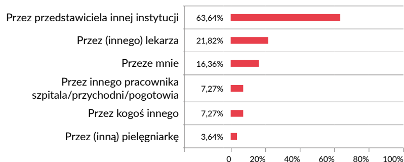
Wykres 2. Przez kogo została założona Niebieska Karta, N = 55, %.

Dzięki wywiadam jakościowym wiadomo, że to, w jaki sposób pracownicy ochrony zdrowia reagują na podejrzenia krzywdzenia dziecka, zależy w dużej mierze od tego, gdzie pracują: w szpitalu, przychodni, innej instytucji oraz od ich roli zawodowej: pielęgniarki, lekarza, położnej.